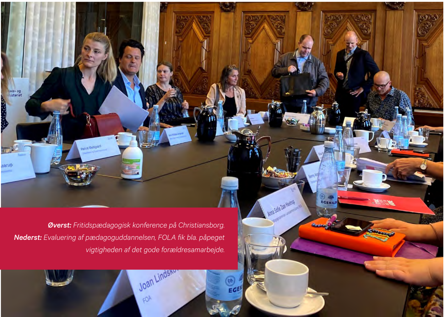
Øverst: Fritidspædagogisk konference på Christiansborg. Nederst: Evaluering af pædagoguddannelsen, FOLA fik bla. påpeget vigtigheden af det gode forældresamarbejde.